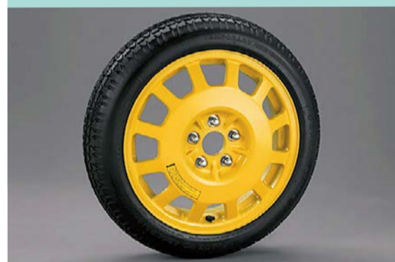
▲スペアタイヤ(テンパータイヤ)は1万円程度。通常 のタイヤよりも空気圧は高くなっています。こちらの空 気圧チェックもお忘れなく