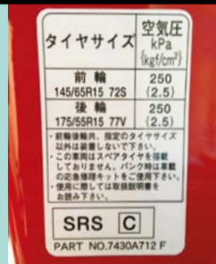
▲まずは自分のクルマ の指定タイヤ空気圧 を把握することが大切

タイヤの適正空気圧とは、車種ごとにメーカーが 指定している車両指定空気圧のことで、運転席 側のドア、ボディなどに貼られた空気圧表示シ ールに記載されています。空気圧の単位としてはk Pa(キロパスカル。100kPa=1.0kgf/cm 2 )を 使うのが現在の主流で、最近は燃費志向もあり 、250kPa(2.5kgf/cm 2 )前後という昔より高め の指定空気圧のクルマも増えています。