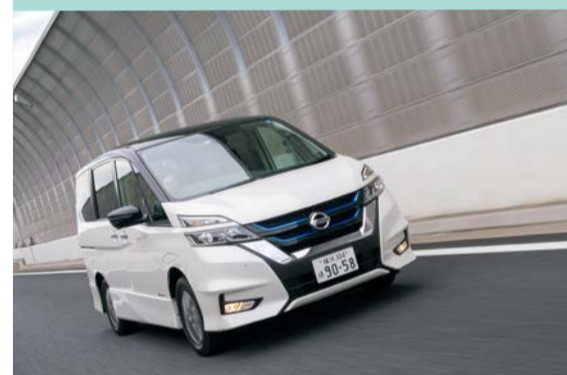
▲空気圧が低い状態で走行を続けているとタイヤ バーストの要因となります。特に高速道路でバース トすると重大事故に発展

タイヤの空気圧については、エアゲージで チェックするのがベストですが、面倒な人はガ ソリンスタンドで給油する時に空気圧チェッ クしてもらいましょう。3か月も放置してい ると、タイヤの空気圧は危険水域となること もあります。最低でも1か月に1回は空気圧を チェックしましょう。