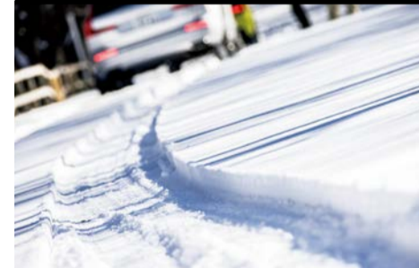
▲スタッドレスタイヤの性能はす ばらしいですが、万能ではな いので過信は禁物